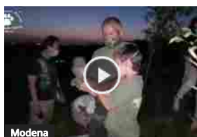
NOTTE DELLE CIVETTE, IL CORONAVIRUS NON BLOCCA L'EDIZIONE 2020