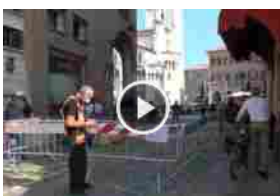
FESTIVALFILOSOFIA, AL VIA UNA EDIZIONE ALL'INSEGNA DELLA SICUREZZA