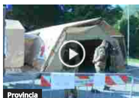
BOMBA A FIUMALBO, CITTA' BLINDATA PER IL DISINNESCO